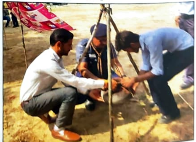
ਕੈਂਪ ਦੌਰਾਨ ਵਿਦਿਆਰਥੀਆਂ ਨੂੰ ਭਤੀਵਿਧੀ ਕਰਵਾਉਂਦੇ ਹੋਏ ਸਕਾਊਟ ਟਰੇਨਰ