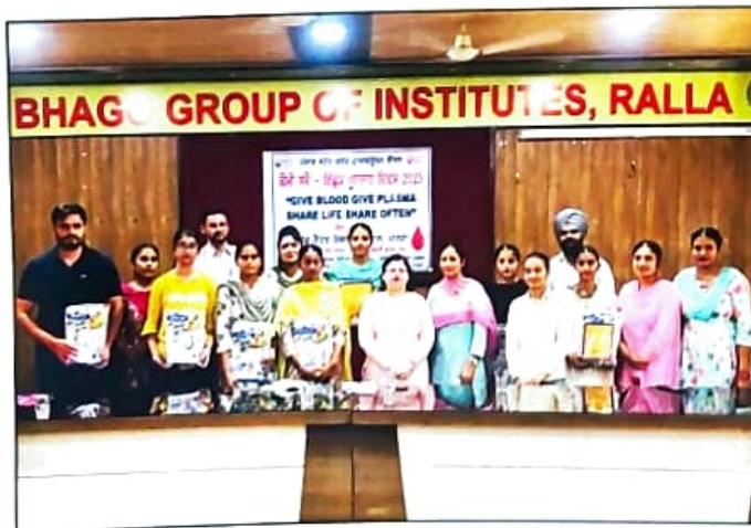
ਕੋਮੀ ਸਵੈ-ਇੱਛਕ ਖੂਨਦਾਨ ਦਿਵਸ ਮੌਕੇ ਪੋਸਟਰ ਮੇਕਿੰਗ ਵਾਲੇ ਵਿਦਿਆਰਥੀਆਂ ਨੂੰ ਸਨਮਾਨਿਤ ਕਰਦੇ ਹੋਏ ਸਿਹਤ ਵਿਭਾਗ, ਮਾਨਸਾ ਦੀ ਸਮੁੱਚੀ ਟੀਮ ਅਤੇ ਪ੍ਰਿੰਸੀਪਲ ਸਾਹਿਬਾਨ