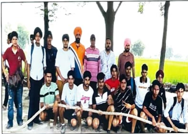
ਖੇਡਾਂ ਵਤਨ ਪੰਜਾਬ ਦੀਆਂ ਮੌਕੇ ਰੌਸਾਕੌਸੀ ਮੁਕਾਬਲੇ ਦੀ ਜੇਤੂ ਟੀਮ