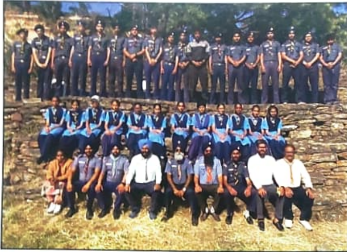
ਤਾਰਾ ਦੇਵੀ (ਸ਼ਿਮਲਾ) ਵਿਖੇ ਸਕਾਊਟ ਐਂਡ ਗਾਈਡ ਕੈਂਪ ਵਿੱਚ ਭਾਗ ਲੈਣ ਵਾਲੇ ਵਿਦਿਆਰਥੀਆਂ ਦੀ ਸਾਂਝੀ ਤਸਵੀਰ