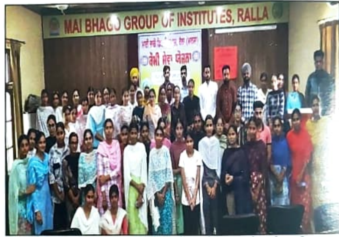
ਕੋਮੀ ਸੇਵਾ ਯੋਜਨਾ ਦੇ ਸਥਾਪਨਾ ਦਿਵਸ ਮੌਕੇ ਵਲੰਟੀਅਰਜ਼ ਦੀ ਸਾਂਝੀ ਤਸਵੀਰ