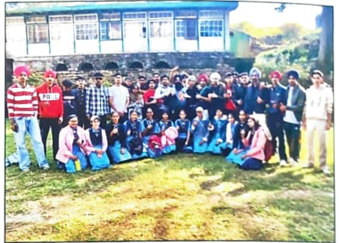
ਸਕਾਊਟ ਐਂਡ ਗਾਈਡ ਕੈਂਪ ਦੌਰਾਨ ਵਿਦਿਆਰਥੀਆਂ ਦੀ ਯਾਦਗਾਰੀ ਤਸਵੀਰ