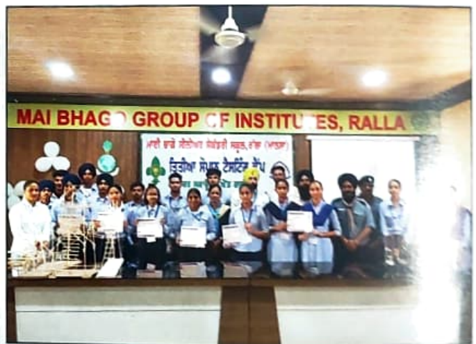
ਸਕਾਊਟ ਐਂਡ ਗਾਈਡ ਕੈਂਪ ਮੌਕੇ ਸਰਟੀਫਿਕੇਟ ਪ੍ਰਦਾਨ ਕਰਦੇ ਹੋਏ ਕੈਂਪ ਪ੍ਰਬੰਧਕ