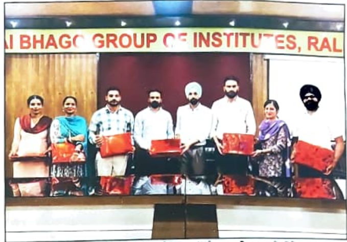
ਅਧਿਆਪਕ ਦਿਵਸ ਮੌਕੇ ਅਧਿਆਪਕਾਂ ਨੂੰ ਸਨਮਾਨਿਤ ਕਰਦੇ ਹੋਏ ਪ੍ਰਬੰਧਕ ਅਤੇ ਪ੍ਰਿੰਸੀਪਲ ਸਾਹਿਬਾਨ