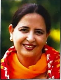
ਗਜ਼ਲਗੋ ਸੁਖਵਿੰਦਰ ਅਮ੍ਰਿਤ ਸ਼੍ਰੋਮਣੀ ਕਾਵਿ ਪੁਰਸਕਾਰ ਵਿਜੇਤਾ ਭਾਸ਼ਾ ਵਿਭਾਗ, ਪੰਜਾਬ