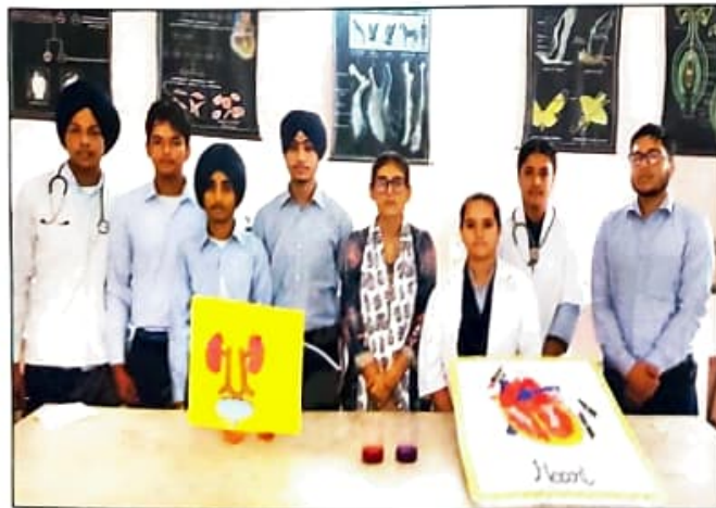
ਸਾਇੰਸ ਦਿਵਸ ਮੌਕੇ ਮਾਡਲਾਂ ਦੀ ਪੇਸ਼ਕਾਰੀ ਕਰਦੇ ਹੋਏ ਵਿਦਿਆਰਥੀ