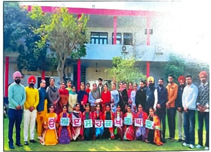
ਕੌਮਾਂਤਰੀ ਮਾਤ ਭਾਸ਼ਾ ਦਿਵਸ ਮੌਕੇ ਮਾਂ ਬੋਲੀ ਪੰਜਾਬੀ ਪ੍ਰਤੀ ਸੁਹਿਰਦ ਸੁਨੇਹਾ ਦਿੰਦੇ ਹੋਏ ਵਿਦਿਆਰਥੀ