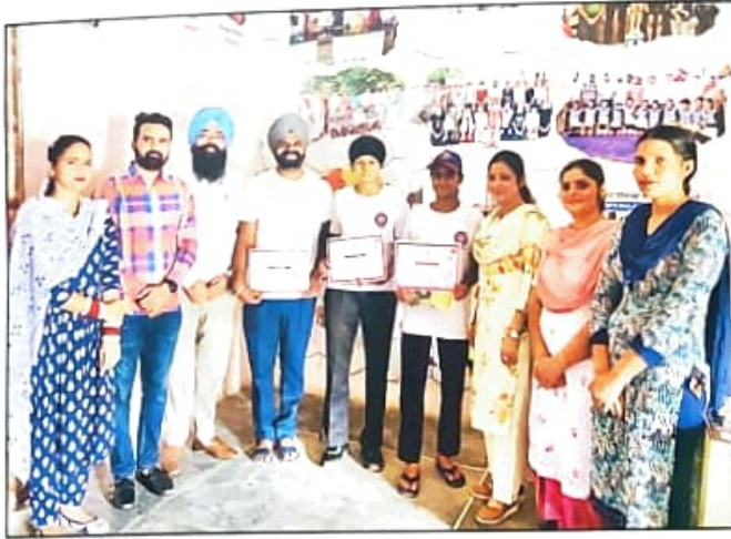
ਨੈਸ਼ਨਲ ਇੰਟੀਗ੍ਰੇਸ਼ਨ ਕੈਂਪ, ਕੈਥਲ (ਹਰਿਆਣਾ) ਵਿਖੇ ਗਏ ਅਧਿਆਪਕ ਅਤੇ ਵਿਦਿਆਰਥੀਆਂ ਨੂੰ ਸਰਟੀਫਿਕੇਟ ਨਾਲ ਸਨਮਾਨਿਤ ਕਰਦੇ ਹੋਏ ਪ੍ਰਿੰਸੀਪਲ ਤੇ ਅਧਿਆਪਕ ਸਾਹਿਬਾਨ