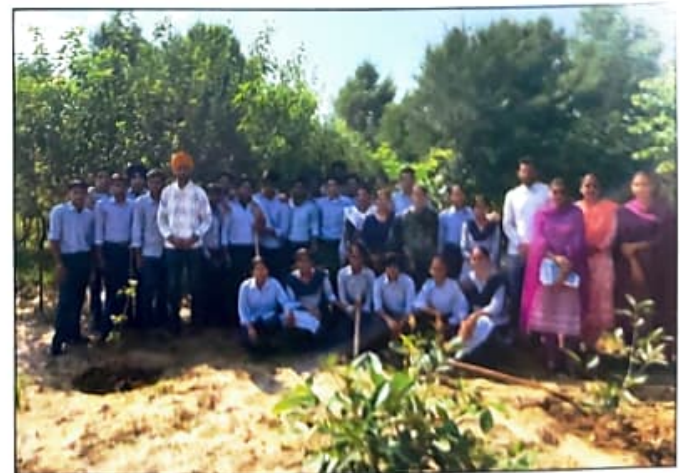
ਕੌਮੀ ਸੇਵਾ ਯੋਜਨਾ ਦੇ ਇੱਕ ਰੋਜ਼ਾ ਕੈਂਪ ਮੌਕੇ ਵਲੰਟੀਅਰਜ਼ ਦੀ ਸਾਥੀ ਤਸਵੀਰ