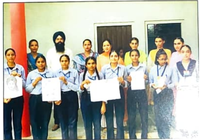
ਸ਼ਹੀਦ ਭਗਤ ਸਿੰਘ ਨੂੰ ਸਮਰਪਿਤ ਪੋਸਟਰ ਮੇਕਿੰਗ ਵਿੱਚ ਭਾਗ ਲੈਣ ਵਾਲੇ ਵਿਦਿਆਰਥੀ