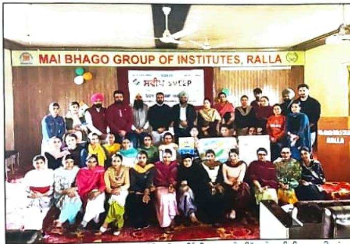
ਸਵੈੱਪ ਮੁਹਿੰਮ ਦੌਰਾਨ ਪੋਸਟਰ ਮੇਕਿੰਗ ਤੇ ਮਹਿੰਦੀ ਮੁਕਾਬਲੇ ਵਿੱਚ ਜੇਤੂ ਵਿਦਿਆਰਥੀਆਂ ਦੀ ਸਾਂਝੀ ਤਸਵੀਰ